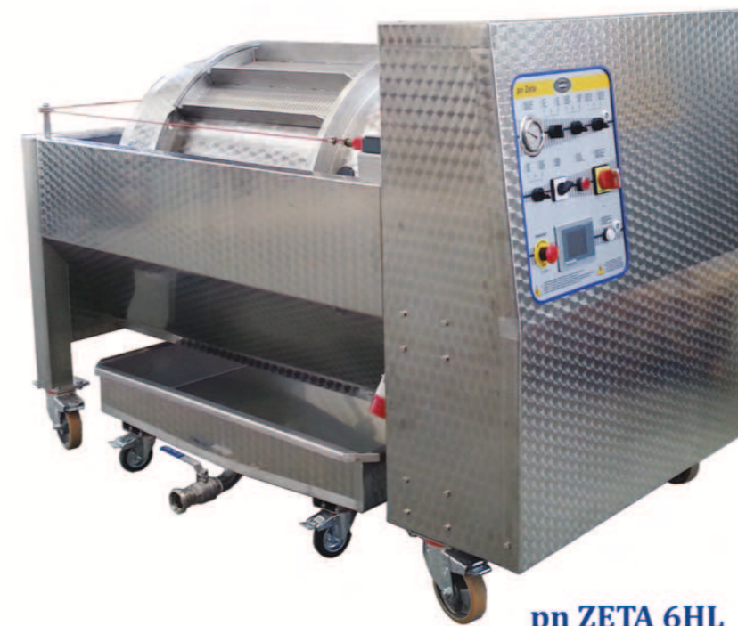
pn ZETA 6HL

Possibilità di rialzare la pressa mediante prolunghe Extension of the legs for press height adjustment Extensión de las patas para ajustar la altura de prensa