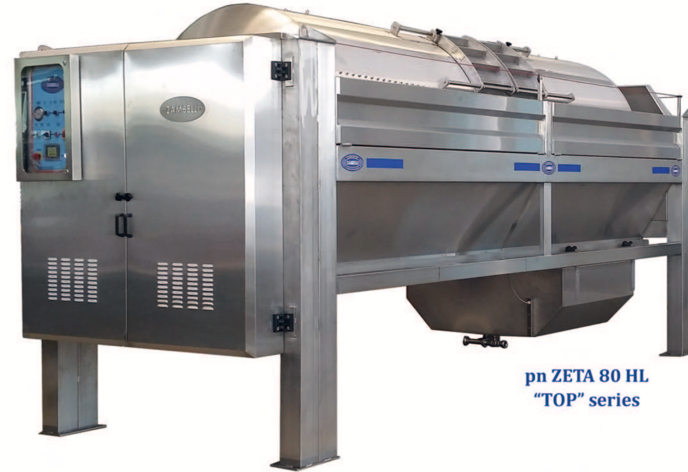
pn ZETA 80 HL "TOP" series